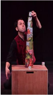
Tours de mains Cie Eclats - France