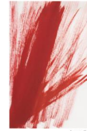
en UN éclat Cie AK Entrepôt - France

Éditeurs responsables : Phaidon Press, Tate Publishing et Bayard