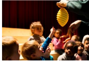
Ceci n'est pas un livre Théâtre de Spiegel - Belgique

L'association éclats est subventionnée par la DRAC Nouvelle-Aquitaine, la région Nouvelle-Aquitaine, le conseil départemental de la Gironde et la Ville de Bordeaux.