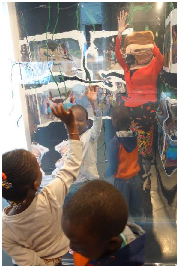
Photos : Forum des Premières Rencontres, Espace Marcel Pagnol, Villiers-le-Bel (95)